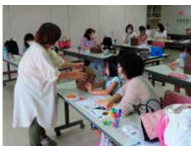
宇宙ボックスづくり

子どもたちの豊かな心の育成を目的に、防災活動や自然にふれる活動など、様々な体験教室を実施しています。親子で参加できる教室など、世代間交流の場としても地域に根付いた活動になっていきます。毎回、たくさんの方たちに、楽しみながら参加していただいています。