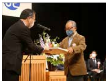
第54回阿南市社会福祉大会での表彰

赤い羽根共同募金の推進、徳島県シルバー大学校阿南校の運営管理、日常生活自立支援事業、社会福祉関係団体等の活動支援と事業協力。