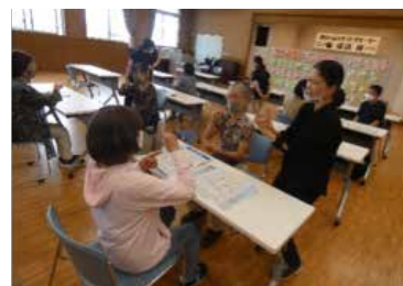
ガイドサポーター養成講座での手話講習