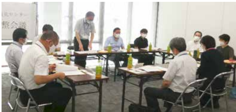
第一回目の会議では、当協議会会長が挨拶をし、制度を管轄する徳島家庭裁判所にご臨席をいただきました。

この会議の委員には法律関係職、福祉関係職をはじめ経験豊富な方々がおりますので、市民の皆様から成年後見制度について聞きたいことがあれば阿南市社会福祉協議会までご相談ください。