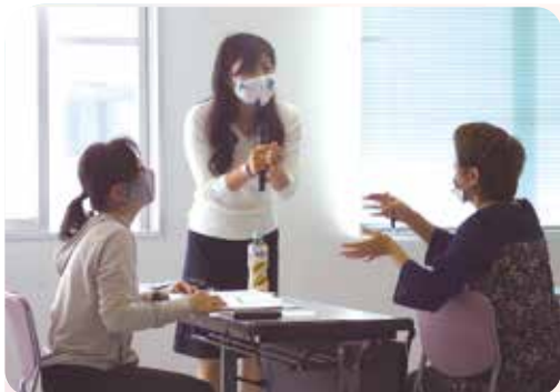
傾聴ボランティア 養成研修会

市内のボランティアに関する相談窓口として活動しています。ボランティアの登録、情報提供、活動支援、育成のための研修会の開催、災害時には、災害ボランティアセンターを開設し、地域の復興支援のお手伝いをさせていただいています。