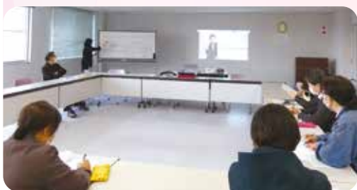
毎月、定例会を行っています。