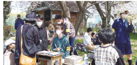
羽ノ浦岩脇公園 ～桜まつり～ (4/2)