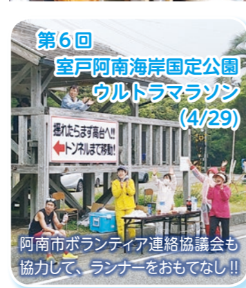
第6回 室戸阿南海岸国定公園 ウルトラマラソン (4/29)