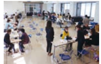
宝田地区 宝田福祉まつり