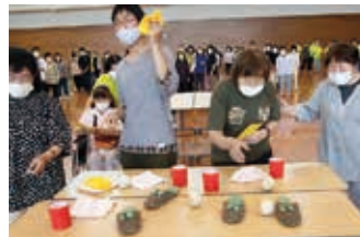
阿南市障がい者体育大会 借り物競争