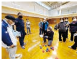
ボッチャ指導者講習会

市実行委員会で4部会8事業、地区実行委員会で延べ68事業を実施し、地域福祉を推進。