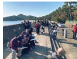
阿南市・見能林地区合同開催 歴史探訪ウォーキング