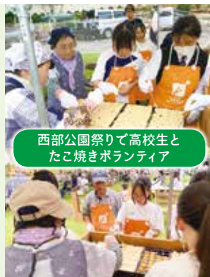
西部公園祭りで高校生と たこ焼きボランティア