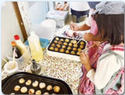
公募事業 (こども食堂事業)

共同募金や社協会費は、地域の様々な社会福祉事業の推進や各種福祉団体の活動などに役立てられています。